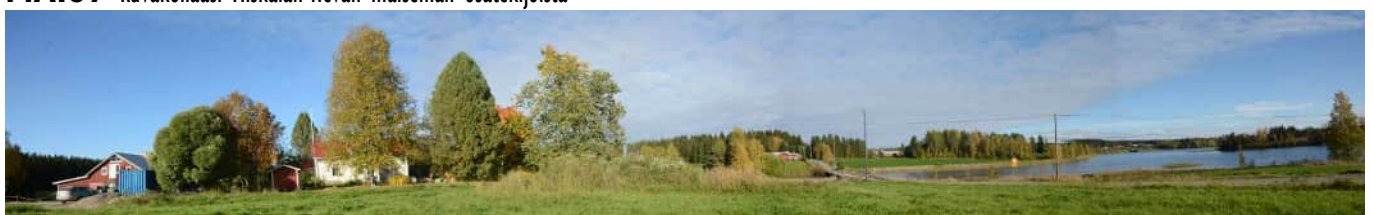
MAI08 Uittosalimesta Kolmisoppeen