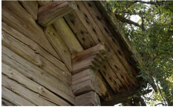
Aitan kattorakenteiden koristeloveuksia.