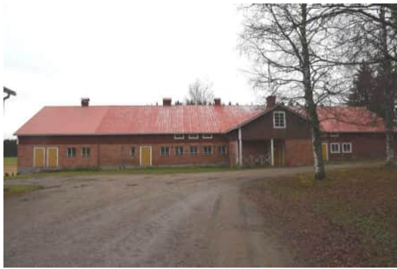
Tiiliseinäinen navetta on valmistunut 1930-luvun puolivälissä