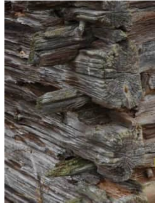
Kaksikerroksinen eloaitta on 1800-luvulta. Nurkkasalvoksen hirret ovat aikojen saatossa syöpyneet melko hatariksi.