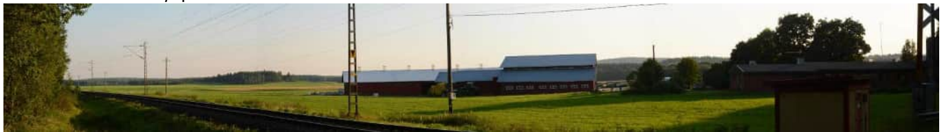
MAI07 Niskalasta etelään, Nevan pelloille