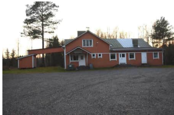
vasemmalla lämpökeskus. Oikealla matala loivakattoinen laajennusosa.