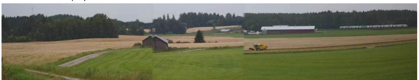
MAI07 Kuvakollaasi Miskalan-Nevan maiseman osatekijöistä