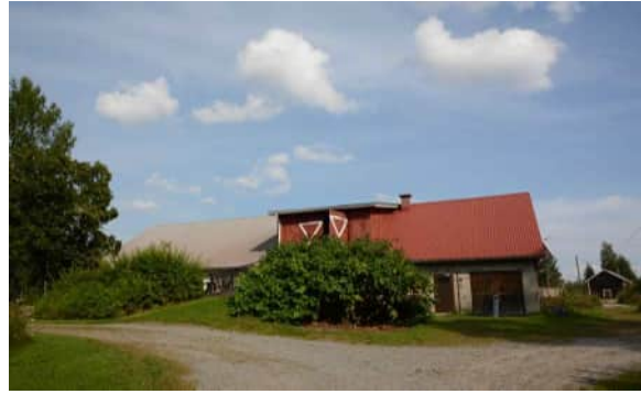
Pihan itäisivulla on navetta vuodelta 1929.