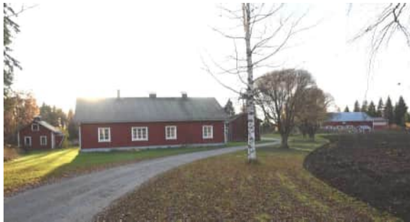
Sotilasvirkataloksi vuonna 1695 muodostetun tilan asuinrakennus.