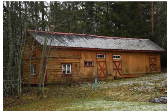
entinen navetta - talousrakennus

Esimerkki 1900-luvun alkupuolen rantasaunan ja talousrakennuksen rakentamista- vasta ja kookkaasta asuinrakennuksesta.