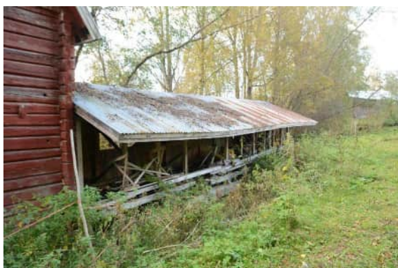
puutavaran sahaussirkkelin katos

Toimintakuntoisena säilytetty myllyrakennus siihen liitettyine sirkkelöintikatoksi- neen on niin hyvä rakennustyyppinsä edustaja, että olisi melkein sellaisenaan kelpo myllymuseo.