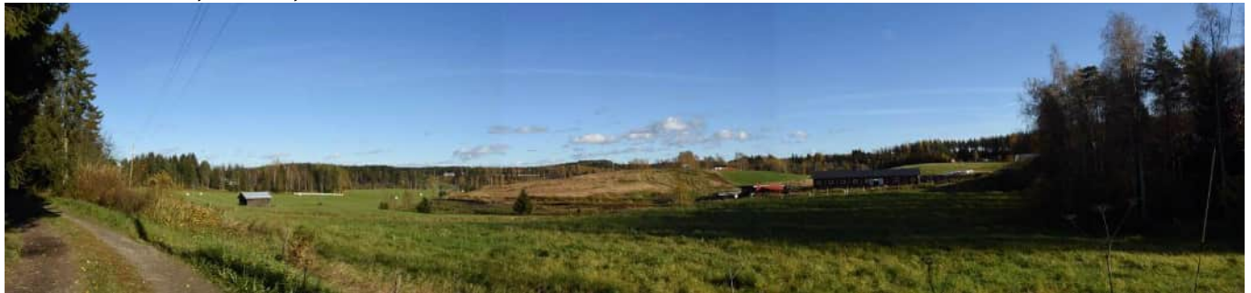
MAI02 Pohjolanmäen lounaisosaa