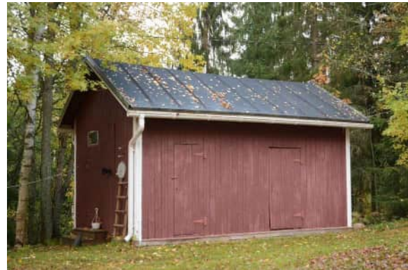
Myös talusrakennus on mittasuhteiltaan kapea ja korkea.

Persoonallinen jyrkkäkattoinen huvila, jossa vaikutteita jugendista.