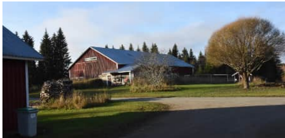
Pihapiirin leveärunkoinen navettarakennus sijaitsee sivummalla.

Umpipiikan muodostavat päärakennus ja sitä tukevat pihapiirin aittarakennukset, joissa aikanaan on majoittunut tilan työväkeä. Asuinrakennus on valmistunut vuonna 1813 ja pihan aittarakennus vuonna 1800.