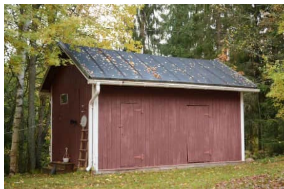
Myös talousrakennus on mittasuhteiltaan kapea ja korkea.

Persoonallinen jyrkkäkattoinen huvila, jossa vaikutteita jugendista.