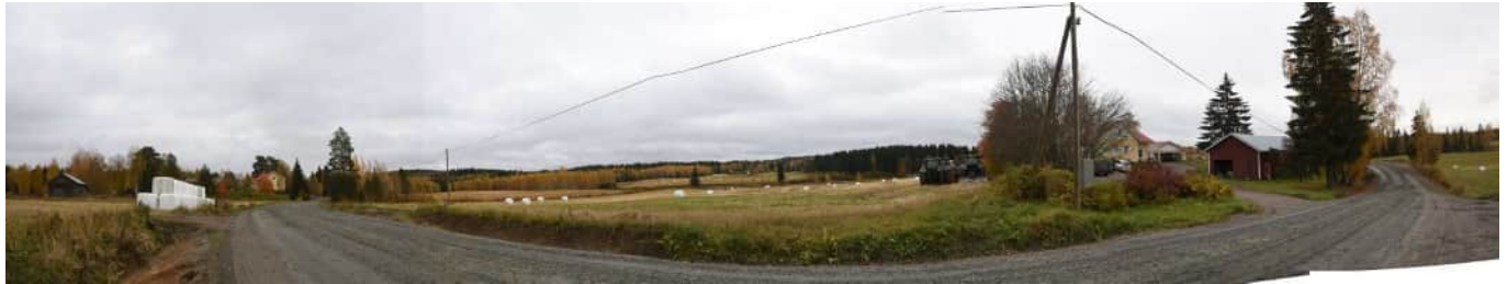
MAI02 Päivärinne ja Hoikinharju