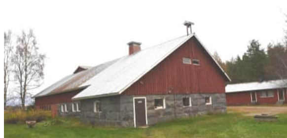
Kivinavetta on rakennettu vuonna 1914.