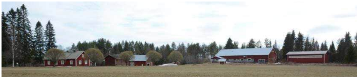
Puustelli Pöljän vanhatieltä. PÖ70_2022-05-10_N7Y_14290