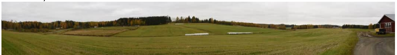
MAI03 Mehtomäen peltomaisemaa tilojen Rinnepelto ja Hiekkapelto välissä