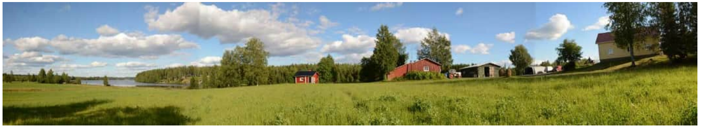
MAI04 Pöljänjärven Riuttalahtea, Riuttaniemeä ja Riuttalahti -tilan peltomaisemaa ja pihapiiriä