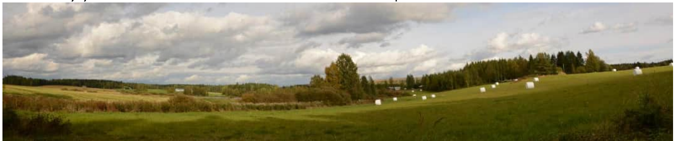
MAI06 Tuli-Koivusen ympäristö