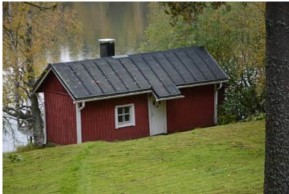
Rantasaunassa on ryhdikkään selkeä olemus.

Huvila-asuinrakennus vuodelta 1933 on tehty pelkkahirrestä. Harvinainen kattomuotojen yhdistelmä, mansardikatto ja harjakatto, molemmissa jyrkkää kattokaltevuutta, korostaa rakennuksen korkeutta, kuten myös huvilan sijoittuminen jyrkkärinteisen harjanteen laelle. Persoonallista yksityiskohdista esimerkkinä muotoillut katospylväät.