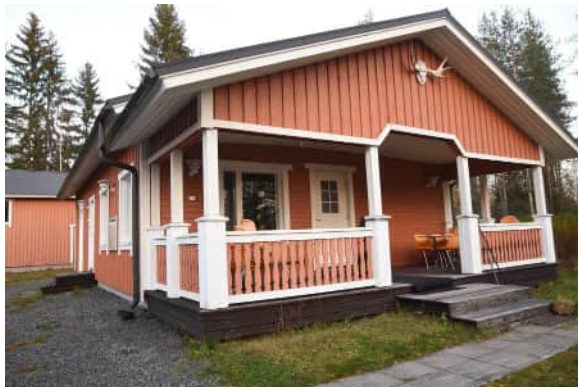
2005 valmistunut saunarakennus -laajennusosa

Vaikka seurantaloon rakennushahmo on muuttunut monissa laajennuksissa, on seurantalolla historiallinen arvonsa.