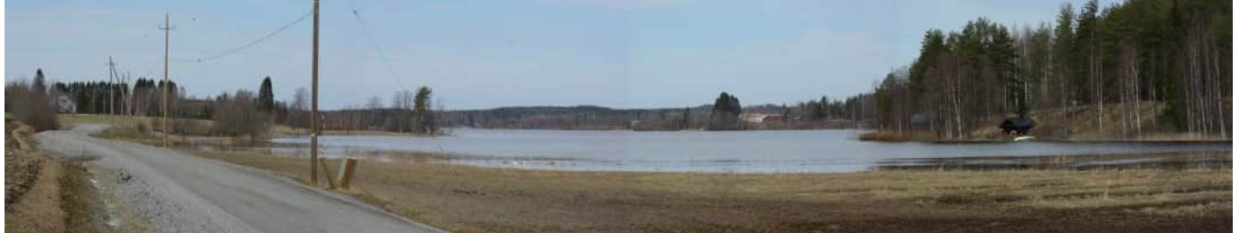
MAI05 Pöljänjärven eteläosan maisemaa. Vasemmalla Vironniemeä. Kaukana oikealla punakattoinen Lintuniemen asuinrakennus.