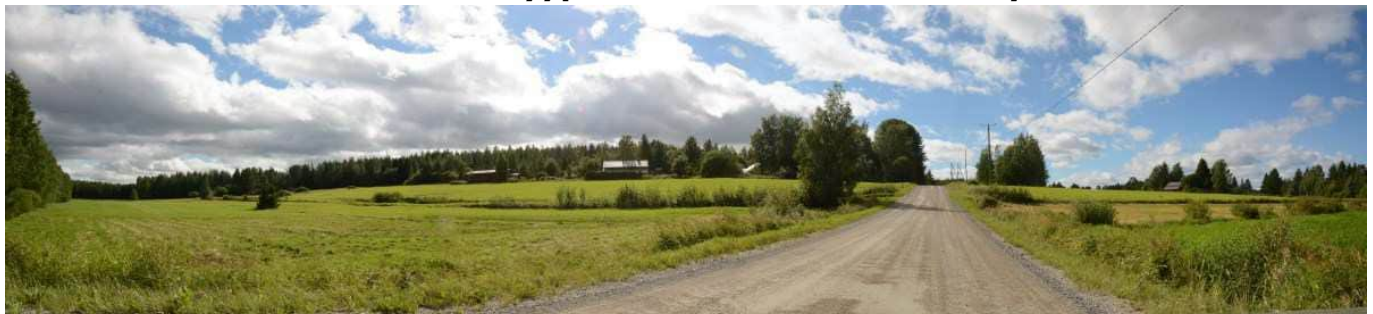
MAI01 Toivolan tilan pellot Hökösentien molemmin puolin