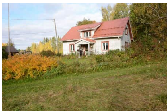
myllärin asuinrakennus valmistui 1933.