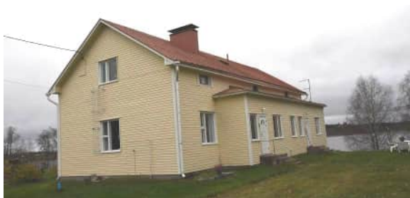
Ikkunamalli ei ole alkuperäinen. Laajennusosa vuodelta 1964.

Vanhan asuinpaikan vuonna 1911 rakennettu asuinrakennus on korotettu nykyiselleen vuoden 1930 tulipalon korjaustöiden yhteydessä. Vuonna 1964 uusittu ulkoverhous on vaakaponttilautaa.