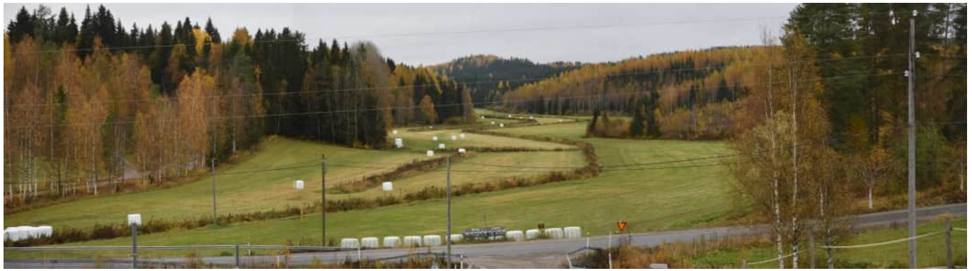
MAI02 Riitaniittyä, kuvattu Pellonpää -tilan luota luoteeseen