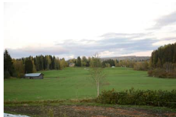
Näkymä Kalliolammen pihasta Varpaisjärventien ja Levämäen suuntaan. Ja vastakkaiseen suuntaan, Varpaisjärventieltä kohti Kalliolampea.

Maisemallisesti hienolla paikalla rinteellön yläosassa oleva asuinrakennus.