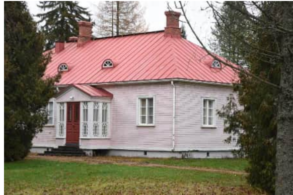
Pihan puoleinen sisäänkäynti lasikuisteineen.