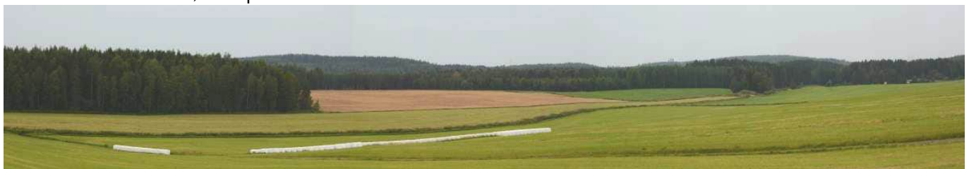
MAI07 Nevan loivia peltoja