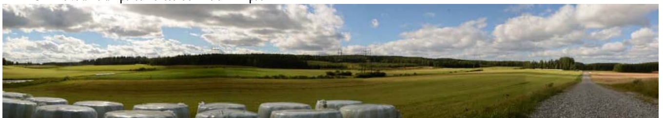
MAI01 Sähkölinjat ja Hökösen maisemapellot