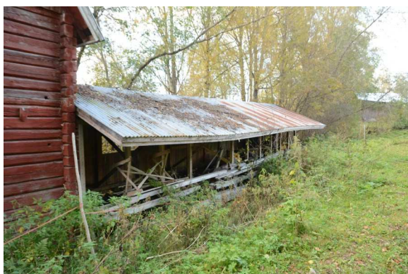
puutavaran sahaussirkkelin katos

Toimintakuntoisena säilytetty myllyrakennus siihen liitettyine sirkkelöintikatoksi- neen on niin hyvä rakennustyyppinsä edustaja, että olisi melkein sellaisenaan kelpo myllymuseo.