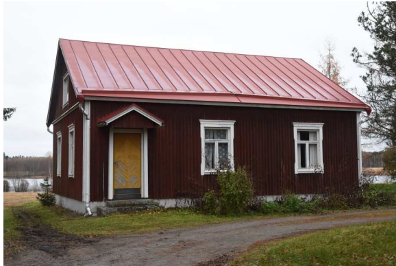
Työväen asuntona ollut rakennus on tehty hirrestä 1930-luvulla.