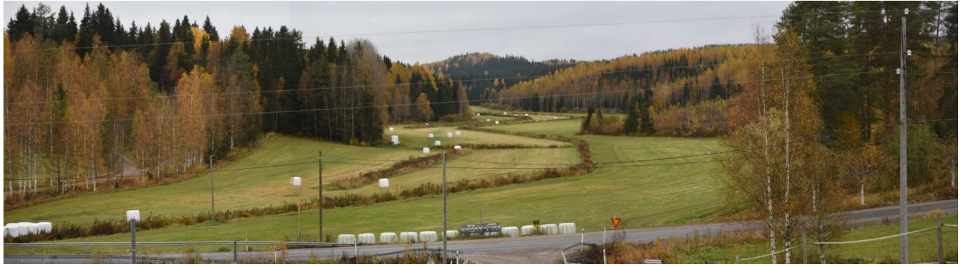
MAI02 Riitaniittyä, kuvattu Pellonpää -tilan luota luoteeseen