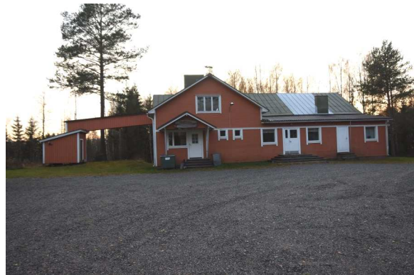
vasemmalla lämpökeskus. Oikealla matala loivakattoinen laajennusosa.