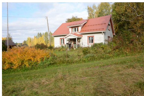
myllärin asuinrakennus valmistui 1933.