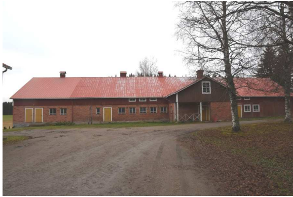
Tiiliseinäinen navetta on valmistunut 1930-luvun puolivälissä