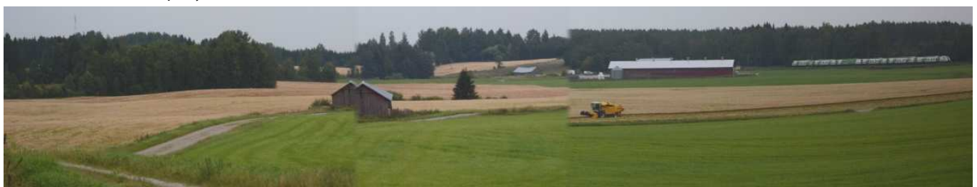
MAI07 Kuvakollaasi Miskalan-Nevan maiseman osatekijöistä