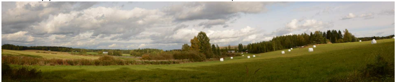
MAI06 Tuli-Koivusen ympäristö