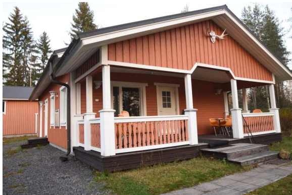
2005 valmistunut saunarakennus -laajennusosa

Vaikka seurantaloon rakennushahmo on muuttunut monissa laajennuksissa, on seurantalolla historiallinen arvonsa.