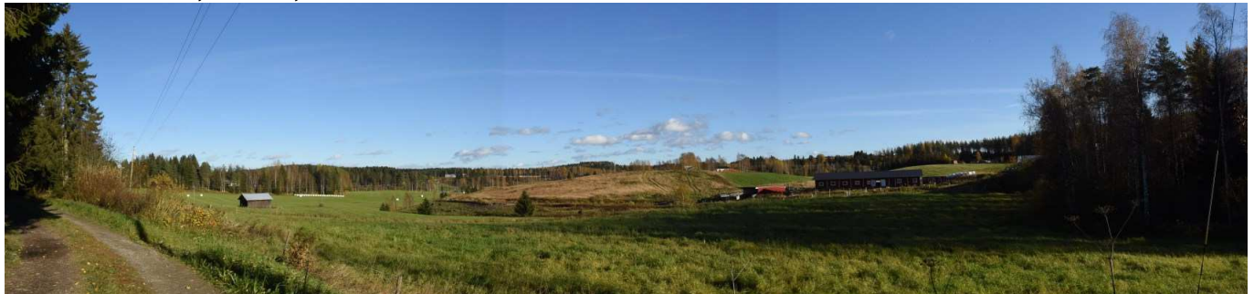
MAI02 Pohjolanmäen lounaisosaa