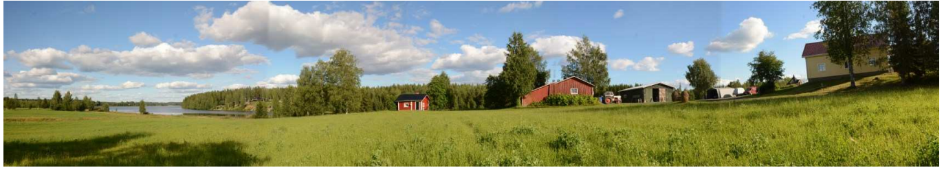
MAI04 Pöljänjärven Riuttalahtea, Riuttaniemeä ja Riuttalahti -tilan peltomaisemaa ja pihapiiriä