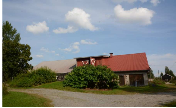
Pihan itäisivulla on navetta vuodelta 1929.