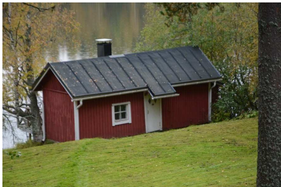
Rantasaunassa on ryhdikkään selkeä olemus.

Huvila-asuinrakennus vuodelta 1933 on tehty pelkkahirrestä. Harvinainen kattomuotojen yhdistelmä, mansardikatto ja harjakatto, molemmissa jyrkkää kattokaltevuutta, korostaa rakennuksen korkeutta, kuten myös huvilan sijoittuminen jyrkkäranteisen harjanteen laelle. Persoonallisista yksityiskohdista esimerkkinä muotoillut katospylväät.