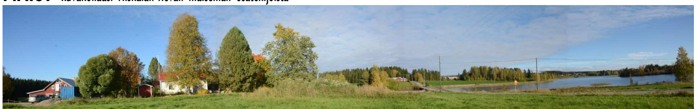
MAI08 Uittosalimesta Kolmisoppeen