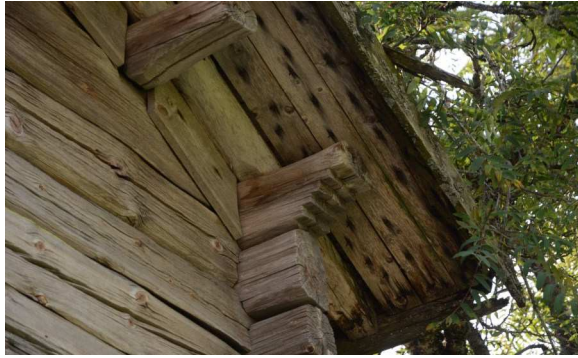
Aitan kattorakenteiden koristeloveuksia.