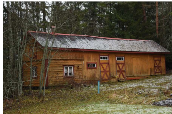
entinen navetta - talousrakennus

Esimerkki 1900-luvun alkupuolen rantasaunan ja talousrakennuksen rakentamista- vasta ja kookkaasta asuinrakennuksesta.