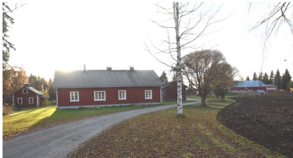
Sotilasvirkataloksi vuonna 1695 muodostetun tilan asuinrakennus.