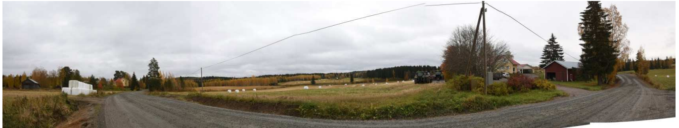
MAI02 Päivärinne ja Hoikinharju