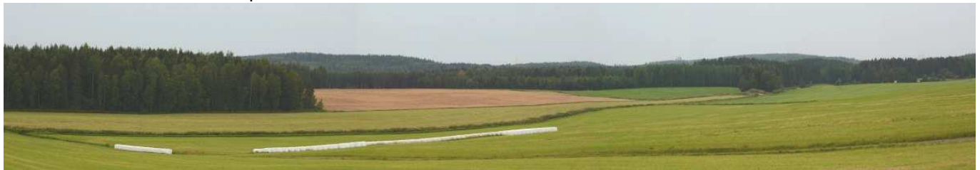
MAI07 Nevan loivia peltoja