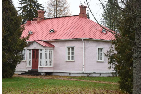
Pihan puoleinen sisäänkäynti lasikuisteineen.