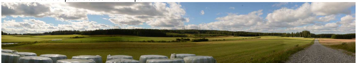
MAI01 Sähkölinjat ja Hökösen maisemapellot