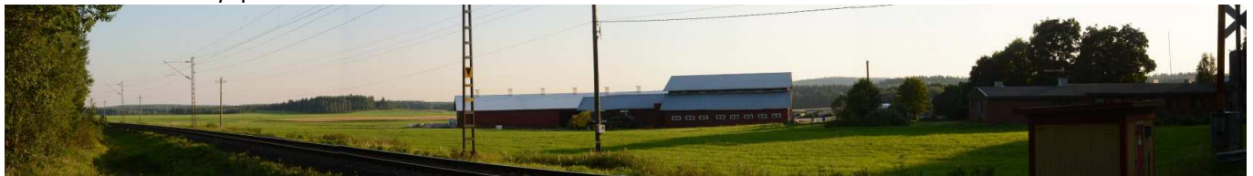
MAI07 Niskalasta etelään, Nevan pelloille