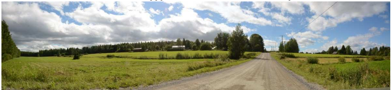
MAI01 Toivolan tilan pellot Hökösentien molemmin puolin