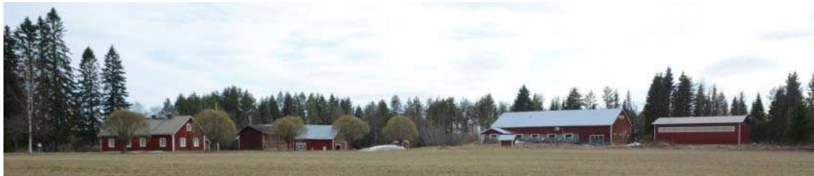
Puustelli Pöljän vanhantieltä. PÖ70_2022-05-10_N7Y_14290