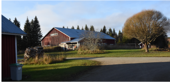
Pihapiirin leveärunkoinen navettarakennus sijaitsee sivummalla.

Umpipiikan muodostavat päärakennus ja sitä tukevat pihapiirin aittarakennukset, joissa aikanaan on majoittunut tilan työväkeä. Asuinrakennus on valmistunut vuonna 1813 ja pihan aittarakennus vuonna 1800.