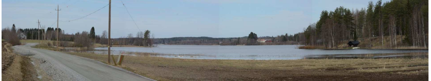
MAI05 Pöljänjärven eteläosan maisemaa. Vasemmalla Vironniemeä. Kaukana oikealla punakattoinen Lintuniemen asuinrakennus.