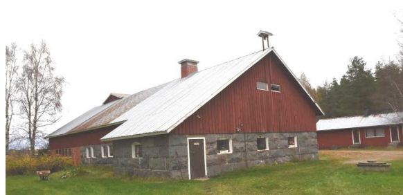
Kivinavetta on rakennettu vuonna 1914.