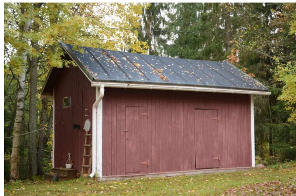
Myös talousrakennus on mittasuhteiltaan kapea ja korkea.

Persoonallinen jyrkkäkattoinen huvila, jossa vaikutteita jugendista.