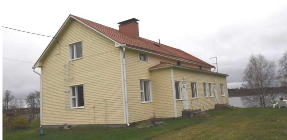
Ikkunamalli ei ole alkuperäinen. Laajennusosa vuodelta 1964.

Vanhan asuinpaikan vuonna 1911 rakennettu asuinrakennus on korotettu nykyiselleen vuoden 1930 tulipalon korjaustöiden yhteydessä. Vuonna 1964 uusittu ulkoverhous on vaakaponttilautaa.