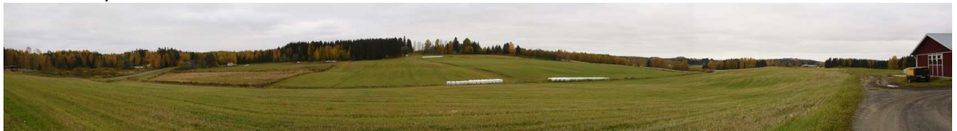
MAI03 Mehtomäen peltomaisemaa tilojen Rinnepelto ja Hiekkapelto välissä